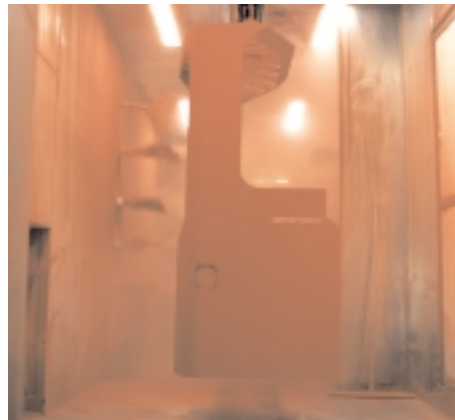
BT arbeitet mit Pulverlackierung, da dies das umweltschonendste Verfahren ist, das heute zur Verfügung steht.