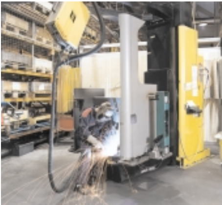
Das Schweißen erfolgt in sauberer Umgebung.

(Sämtliche Daten stammen aus dem Werk von BT in Mjölby/Schweden und beziehen sich auf REFLEX Schubmaststapler.)