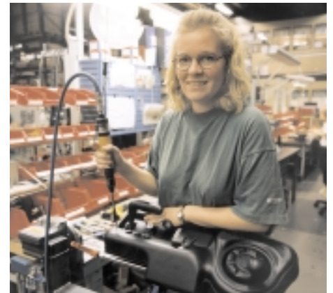
Die Montage erfolgt in sauberen Werksräumen.