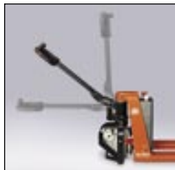
Endlagenschalter aktiviert Bremse in waagerechter und senkrechter Deichselposition.