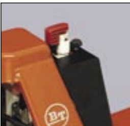
Notausschalter. Kann als Schlüssel verwendet werden.