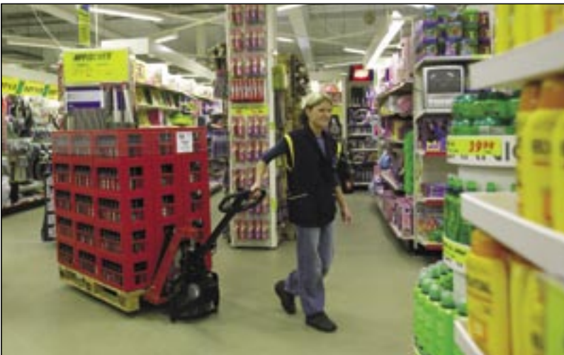
Der flexible und einfach zu bedienende PRO LIFTER M ist ideal für den Einsatz in Ladengeschäften.